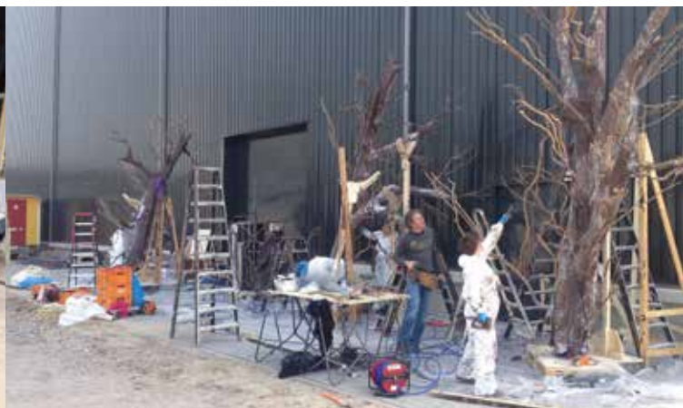
Het eigen ploegje van de productie maakt decor en toneelvloer passend. Rechts wordt de kastanjeboom gemaakt.