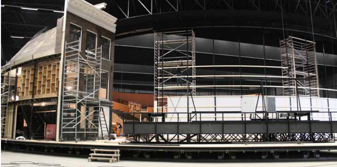
Goed te zien zijn de ronding van het toneel en de rondlopende vakwerkconstructie bovenin. Op de decorwagen de Prinsengracht, tussendoor is de tribune zichtbaar.