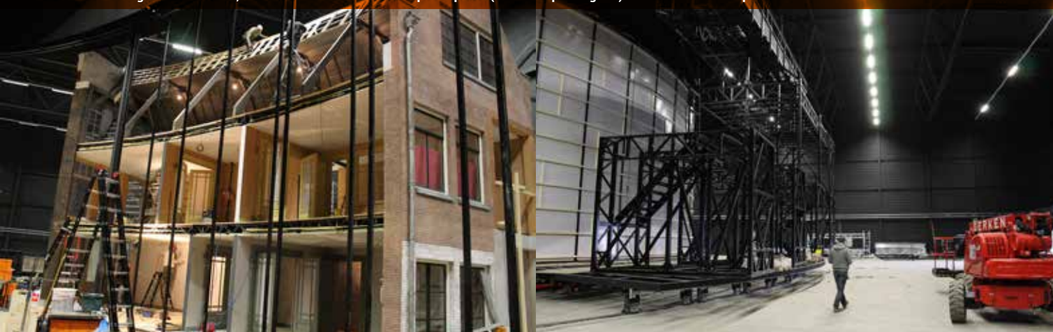
Decor Prinsengracht in aanbouw, rechts staalconstructie Merwedeplein op rails (met rode spanningsrail) en erachter de rondlopende wand.

De decorwagens zijn 6 meter diep en tussen de 15 en 45 meter breed, wat het in- en uitchangeren van de drie grote decorsets tot een belevenis op zich maakt. Bij het eerste changement rijdt de Parijse Brasserie naar rechts richting Achterhuis, terwijl vanaf links 30 ton Merwedeplein komt aanrijden. Als die op zijn plek staat worden de zijwangen omgeklapt en vergrendeld. Dan schuiven de projectieschermen weer open. Bij het volgende changement rijdt het Merwedeplein terug naar zijn plek, de Brasserie erachteraan. Die wordt strak tegen het Merwedeplein geparkeerd. Dan komt 50.000 kilo Prinsengracht het toneel oprijden, een binnenplaats met kastanjeboom als een aanhanger er achteraan. Het Merwedeplein is compleet met woon- en slaapkamers, portiek en trappenhuis. Het Prinsengrachtdecor zou met een extra buitenwandje zo bewoonbaar gemaakt kunnen worden. De wagens