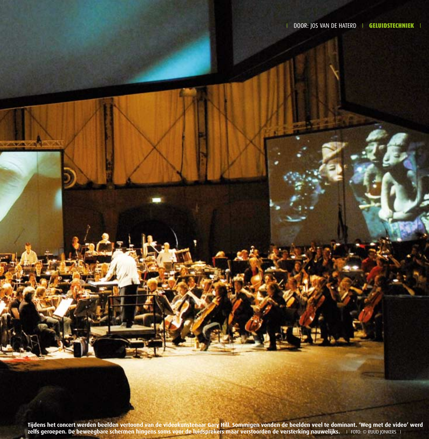
Tijdens het concert werden beelden vertoond van de videokunstenaar Gary Hill. Sommigen vonden de beelden veel te dominant. 'Weg met de video' werd zelfs geroepen. De beweegbare schermen hingens soms voor de luidsprekers maar verstoorden de versterking nauwelijks.

te doen stonden. Hij moest de nagalm indammen om het grote orkestgeluid tot zijn recht te laten komen. Hij moest een manier vinden om ensembles, koor en fluitsolo te versterken, zonder dat het in schril contrast zou staan met dat enorme orkest. En hij moest een surround systeem ontwerpen. Dat laatste was onder deze omstandigheden nog de eenvoudigste opgave, tenminste als de galm kort genoeg zou zijn. De eerste uitdaging was dus de akoestiek. Daarna moest hij een onhoorbare versterking zien te realiseren.