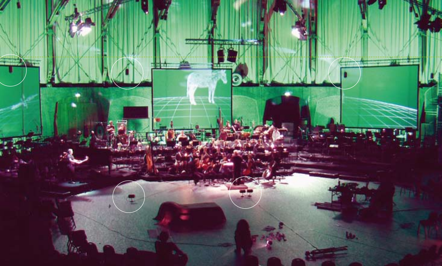
Tijdens de repetitie zijn enkele OmniWave luidsprekers op de vloer te zien, horizontaal op statief en ongeveer 5,5 meter daarboven in verticale positie. De hoek van 90 graden is onderdeel van het concept.

voldoening geeft het mij als de mensen niet in de gaten hebben dat het versterkt is.' Hij wist dat hij aan het grote orkest nauwelijks iets zou hoeven doen, misschien een enkel slagwerkinstrument optillen. 'Maar de ensembles moest ik groter maken, omdat die anders weg zouden vallen tegenover de orkeststukken. Hetzelfde gold voor het mannenkoor. En ook van de fluitsolo zou zonder versterking heel weinig overblijven.' Hij had dus een luidsprekersysteem nodig. Maar luidsprekers hebben nadelen. Je moet ze heel precies installeren en inregelen, anders hoor je het geluid uit de luidsprekers komen in plaats vanaf het podium. Het klinkt nooit op alle plaatsen in de zaal hetzelfde. En bovendien kleuren luidsprekers het geluid altijd een beetje, terwijl hij een zo natuurlijk mogelijke versterking wilde. Hij had in de kleine zaal van het Concertgebouw al eens gewerkt met het Bloomline luidsprekersysteem, dat een zekere faam heeft verworven als 'de onhoorbare luidspreker'. Ook van collega's hoorde hij positieve ervaringen over dit nogal revolutionaire concept 1 . Jan Panis besloot om het erop te wagen. Wat hij uiteindelijk heeft gebruikt zijn elf kleine, zwarte luidsprekertjes. Ze staan horizontaal op een vloerstatiefje