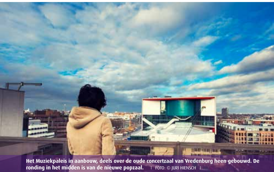
Het Muziekpaleis in aanbouw, deels over de oude concertzaal van Vredenburg heen gebouwd. De ronding in het midden is van de nieuwe popzaal. | FOTO: © JURI HIENSCH |

hebben gezegd: één goederenlift is geen lift. Dus hebben we er twee.' De grootste is vijf bij vier meter en kan 13.000 kg hebben. De tweede goederenlift is half zo groot. Daarnaast zijn er nog vijf personenliften. Met de grote goederenlift gaan we naar level -2, de ondergrondse expeditie, zo groot als een parkeergarage en met aparte loading areas voor horeca en productie. Erik Mans: 'Hier kunnen zes vrachtwagens, trailers of sleepercoaches staan, alleen voor onze producties. Voor deze expeditie hebben we hard gestreden, deze ruimte hebben we echt nodig. Kijk alleen al naar de merchandise die internationale acts meebrengen, zo'n loading