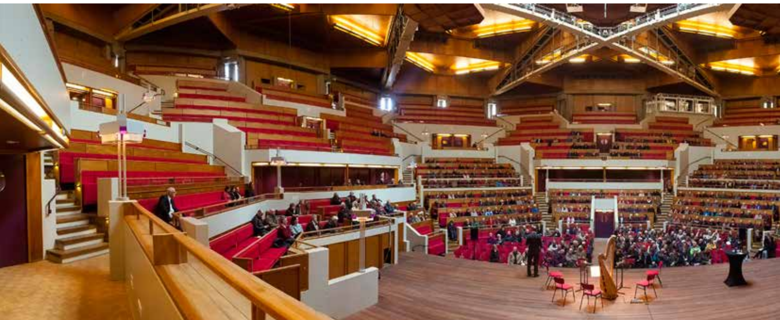
De Grote Zaal met 1717 stoelen is gerenoveerd, maar verder intact gebleven.

de toekomst ontworpen. Ik weet niet of dat zo is. Wat ik wel weet: hier gaan magische optredens plaatsvinden.'