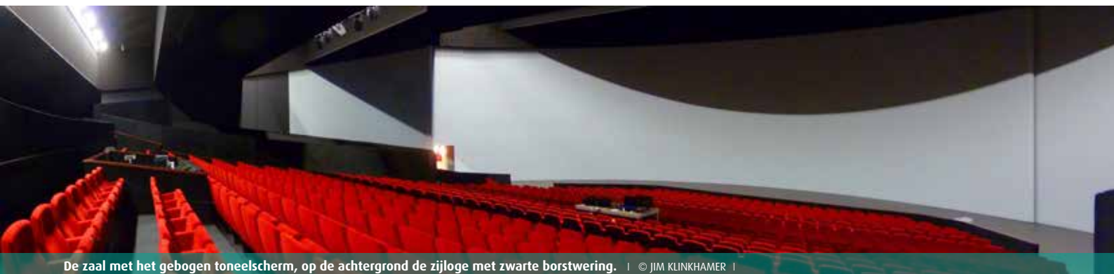
De zaal met het gebogen toneelscherm, op de achtergrond de zijloge met zwarte borstwering.

Opdrachtgever: Image Nation Architect: Dedato, Amsterdam www.theateramsterdam.nl