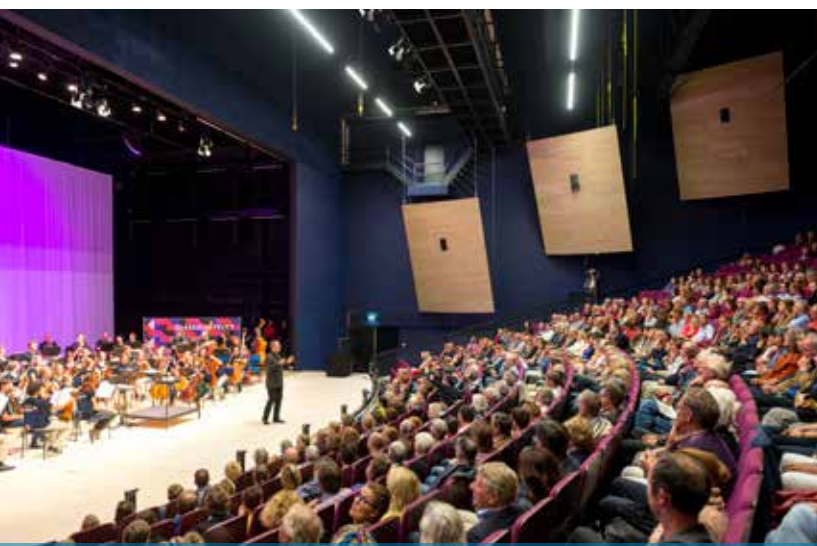
De zaal, met akoestische panelen, is qua formaat geënt op het Lucent Danstheater. | FOTO: © FRANK PENDERS. |

meenemen uit het Lucent theater. Gelukkig konden we die overnemen van de Theaterfabriek in Amsterdam, dat was een koopje. Het transport was duurder dan de stoelen zelf. Joop van den Ende, de eigenaar van de Theaterfabriek, had ze ooit van de opera van Stuttgart gekocht. De paarse bekleding past gelukkig goed bij de blauwe kleur in de zaal. Ook de garderobe en de buffetten nemen we over van de Theaterfabriek.' Behalve de