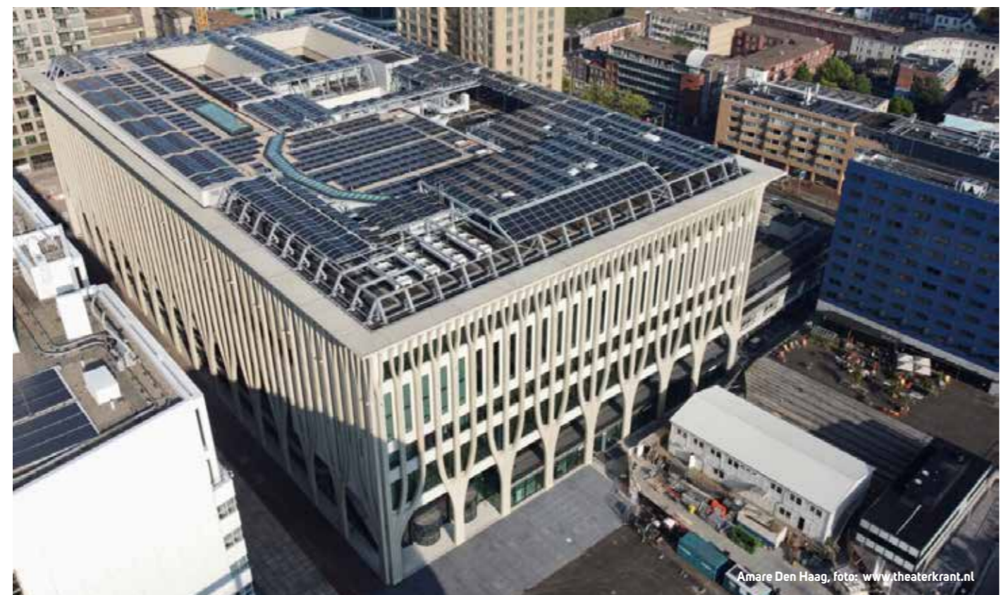
Amare Den Haag

Ook hier kan de culturele sector toch enigszins invloed uitoefenen, bijvoorbeeld op het gebied van infrastructuur. Denk daarbij aan het kiezen van een geschikte locatie voor een nieuw te bouwen theater, maar bijvoorbeeld ook aan het stimuleren van reizen met het OV of de fiets (zowel voor bezoekers als voor medewerkers) en ook op het gebied van innovatie kan de sector – in samenwerking met de overheid, die innovaties moet stimuleren en faciliteren – een wezenlijke rol spelen. Een opmerkelijk verschil tussen Nederland en de rest van Europa is dat in Nederland de artiesten langs de theaters en podia reizen; tal van trailers vol met materiaal trekken van stad naar stad om hier de boel voor een paar dagen aan voorstellingen op te bouwen, om vervolgens weer af te breken en naar de volgende plaats te reizen. In de rest van Europa worden voorstellingen voor langere tijd op een locatie opgebouwd en zijn het de bezoekers die