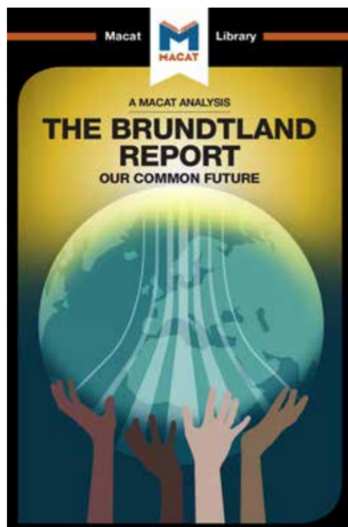
1987 - Brundtland rapport