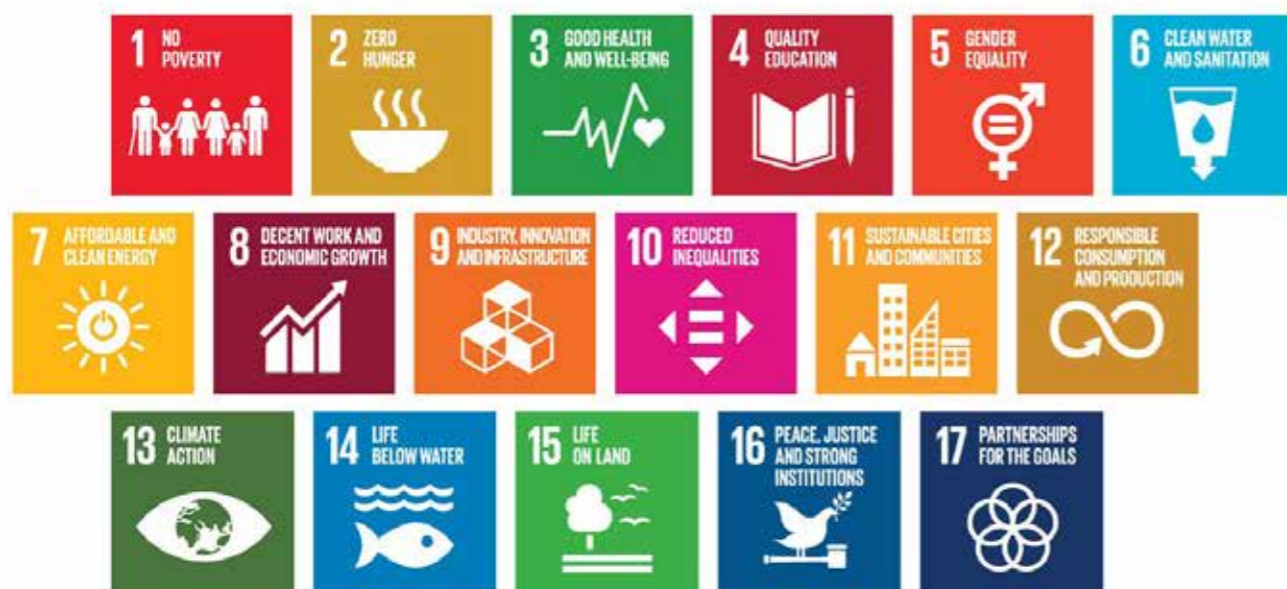
2015 - Sustainable Development Goals