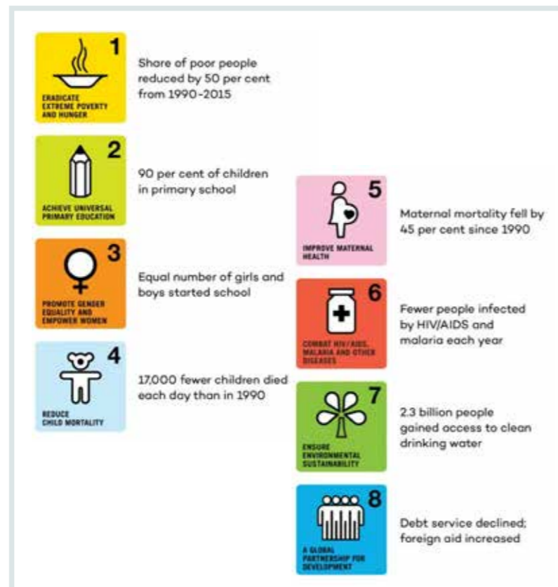
2000 - United Nations Millennium Declaration